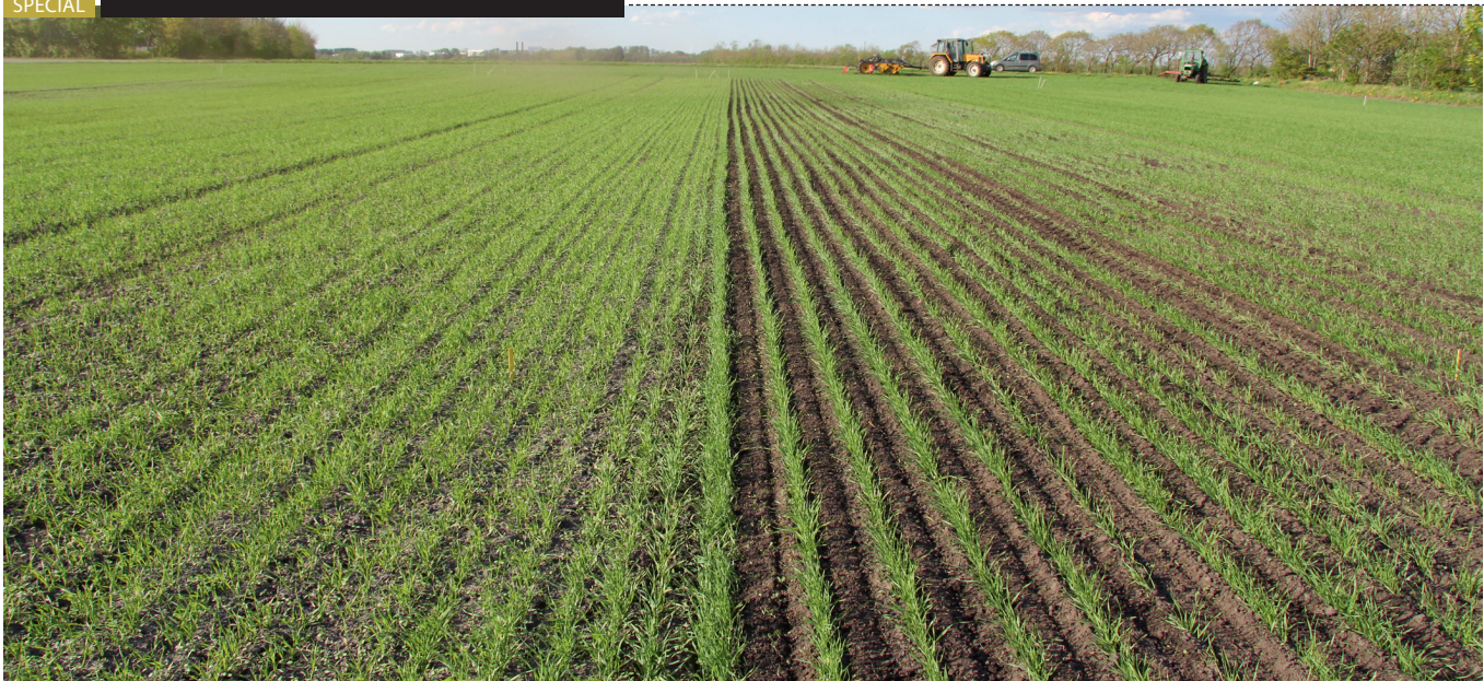
Forsøg med radrensning i vårhvede. Til venstre behandlet på 12,5 cm rækkeafstand og til højre radrenset på 25 cm rækkeafstand.